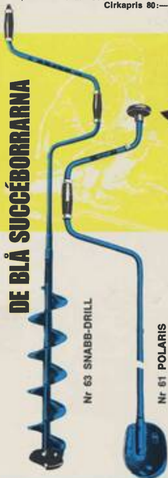
Nr 63 SNABB-DRILL