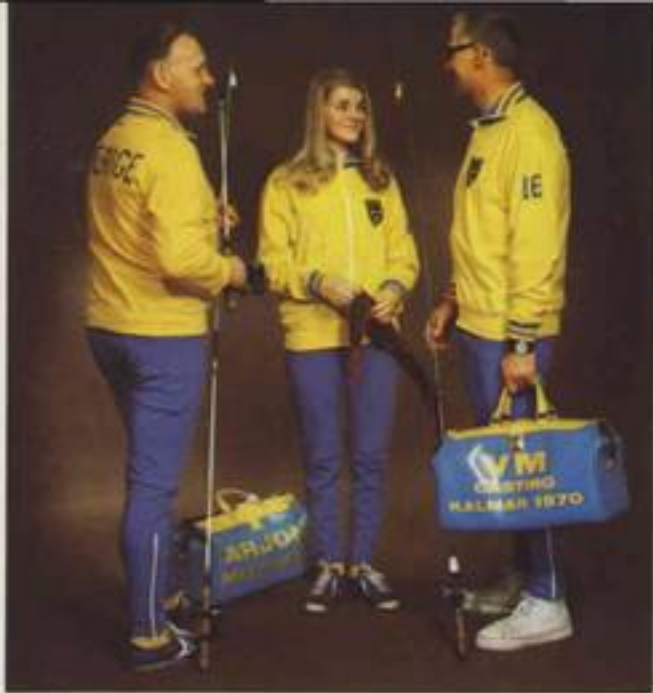
Några världs- och nordiska mästare ur VM-truppen 1970